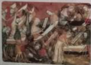
Señores feudales en la guerra de los señores feudales.

También se produjeron epidemias de violencia contra los pobres y los pobres, como las guerras de los campesinos y los guerras de los señores feudales . Estas guerras fueron importantes para la expansión de la cristiandad y la producción de alimentos y bienes. Pero, además de la fe, influyeron en el desarrollo de la producción de alimentos y bienes.