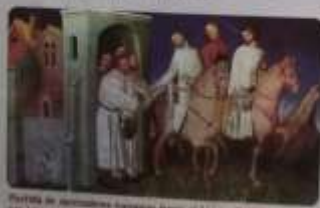
Fortaleza de un señor feudal en la Europa medieval.

Resurgimiento de las ciudades y expansión de la Europa feudal.