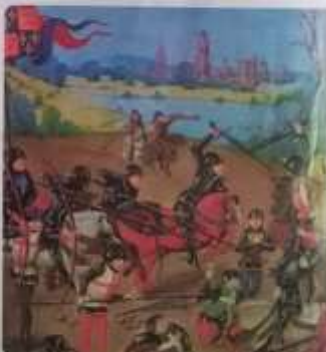
Una escena de la Batalla de Agincourt, durante la Guerra de los Cien Años.