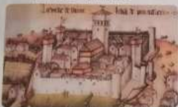
Una ciudad medieval, ilustración del siglo IX.

Los señores nobles encontraron una nueva fuente de riqueza en las ciudades que surgían en su jurisdicción, ya que gravaron con impuestos y peajes las transacciones comerciales.