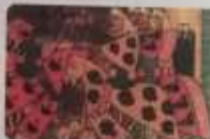
Unos de los señores feudales, representados por el papa Urbano II.

Otra gran fuerza que impulsó los señores feudales fue la persecución religiosa , donde se actuó la reconquista de los territorios que los señores feudales ocupaban a comienzos del siglo IX.