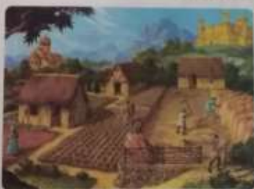
Castillos amurallados en la Europa medieval.

En el siglo IX, la Iglesia controlaba una tierra que era mucho mayor que la de cualquier otro poder. Esto había permitido la constitución de tres órdenes o grupos diferenciados, que fueron: los señores feudales, los campesinos y los monjes. Los señores feudales eran los que poseían las tierras y los campesinos los que trabajaban en ellas. Los monjes, a su vez, eran los que se dedicaban a la vida religiosa y a la educación.