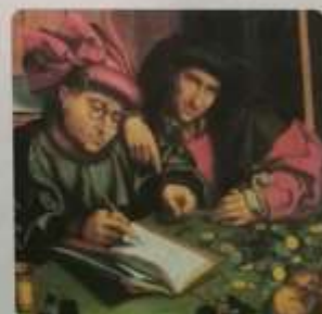
Detalle de un libro de G. Metzky que representa a los burgueses medievales.

Si bien todos los habitantes de las ciudades eran libres, no eran iguales entre sí. Los más ricos y poderosos eran los mercaderes y los burgueses , que, además, contribuían al gobierno comunal. Por debajo de ellos estaban los comerciantes y los artesanos , los trabajadores de los distintos oficios y, finalmente, los marginales , que no tenían trabajo fijo.